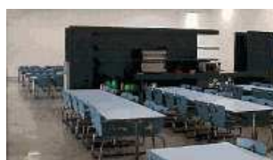
La salle à manger